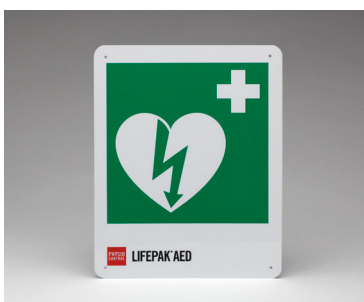
Oznakowanie płaskie lokalizacji ILCOR 11998-000327 (z logo, 20,3 cm x 25,4 cm)