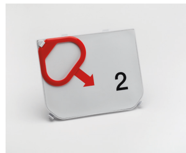
Osłona tacki z zapasowymi elektrodami 11250-000139