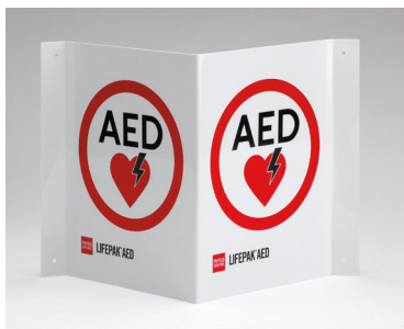
Oznakowanie lokalizacji AED typu namiotowego 11998-000332 (z logo, 17,8 cm x 20,3 cm)