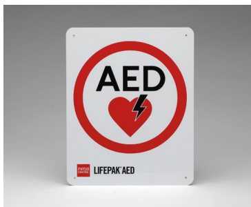
Oznakowanie płaskie lokalizacji AED 11998-000330 (z logo, 20,3 cm x 25,4 cm)