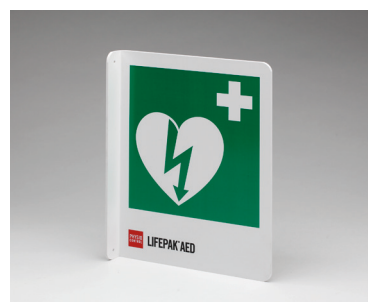
Oznakowanie lokalizacji ILCOR typu T-mount 11998-000328 (z logo, 20,3 cm x 25,4 cm)