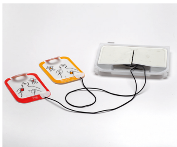
Tacka z zapasowymi elektrodami szkoleniowymi Zawiera 1 zestaw elektrod i osłonę tacki. 11250-000145