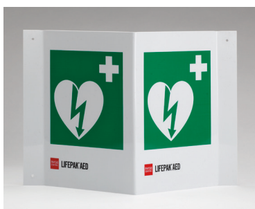
Oznakowanie lokalizacji ILCOR typu namiotowego 11998-000329 (z logo, 17,8 cm x 20,3 cm)