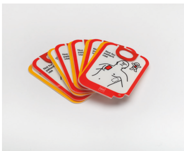
Zestaw elektrod szkoleniowych Zawiera 5 par elektrod. 11250-000140